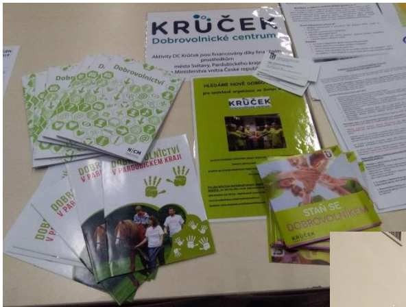
Prezentace na Veletrhu sociálních služeb, který proběhl ve Fabrice dne 7. října: